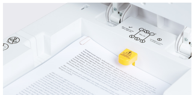
Détruit aussi les documents avec agrafes et trombones.