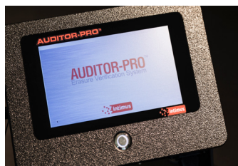
Crée des certificats d'effacement - utilisation écran tactile