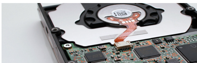
Effacement sécurisé et complet des données des disques durs