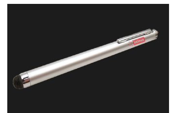
Stylus pour une utilisation confortable de l'écran tactile