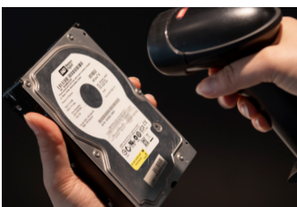
Scanne les numéros de série des disques avant effacement